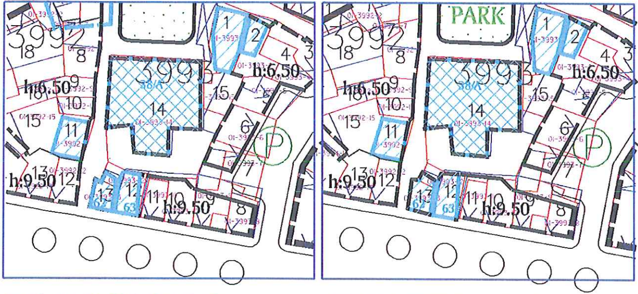
OBM'İNİN 04.02.2015 TARİH VE 114 SAYILI KARARI İLE KABUL EDİLEN PLAN DEĞİŞİKLİĞİ

Osmangazi Belediye Meclisi'nin 04.02.2015 gün ve 114 sayılı kararı ile kabul edilen, Büyükşehir Belediye Meclisi'nin 19.03.2015 gün ve 535 sayılı kararı ile onaylanan ve BKVKBK'nun 13.06.2015 gün ve 4593 sayılı kararı ile uygun görülen plan değişikliği ile (UİP-9396,1), 3993 ada 13 parseldeki tescilli yapı taramasının ve imar hattının kadastral sınırlara oturtularak düzenlenmesine karar verildiği belirtilmiş olmasına rağmen yapılan çizimde 12 parseldeki binanın batısındaki kısmının ve 13 parseldeki binaya dahil edildiği, ayrıca 12 ve 13 parsellerin birleşiminde de binaların iç içe geçtiği tespit edilmiştir.