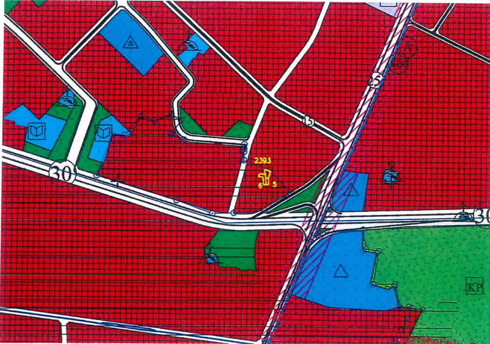
Onaylı 1/5000 ölçekli Nazım İmar Planı

Plan deęişiklięine konu 2393 ada 4-5-6 adalar, onaylı 1/5000 ölçekli Osmangazi Nazım İmar Planı'nda Kentsel Sit Alanı içinde Merkezi İş Alanında yer almaktadır.