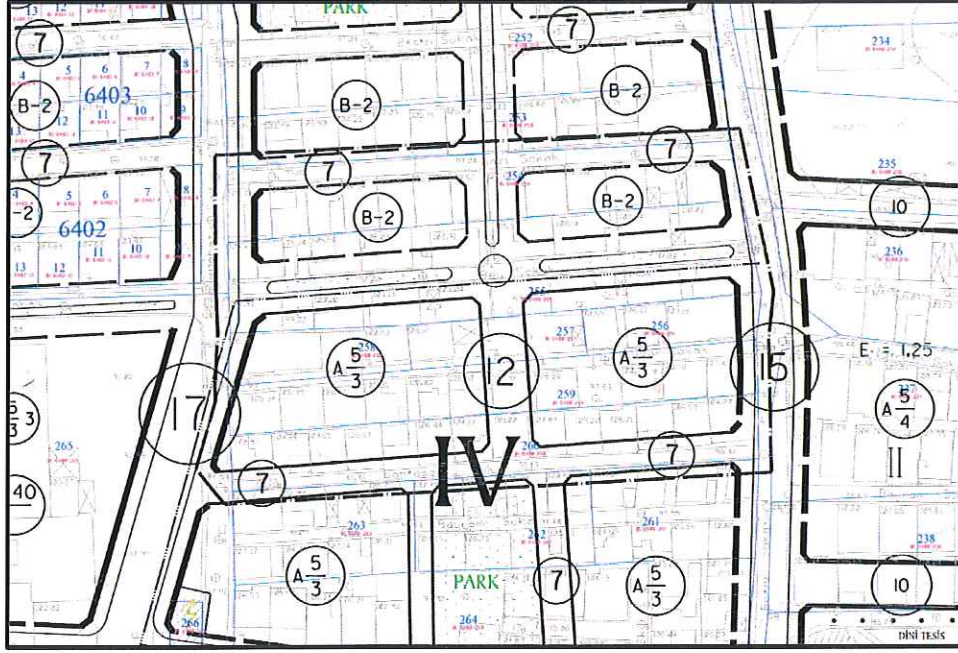
Onaylı 1/1000 Ölçekli Uygulama İmar Planı

6400 Ada, 254-255-256-257-258-259-260 Parsellerde mevcut durumda iyi ve orta durumda yapılar yer almaktadır. Onaylı imar planına bakıldığında parseldeki yapıların yol alanında kaldığı görülmüştür. Mevcut durumdaki yapıları kurtarmak için plan değişikliği hazırlanmıştır.