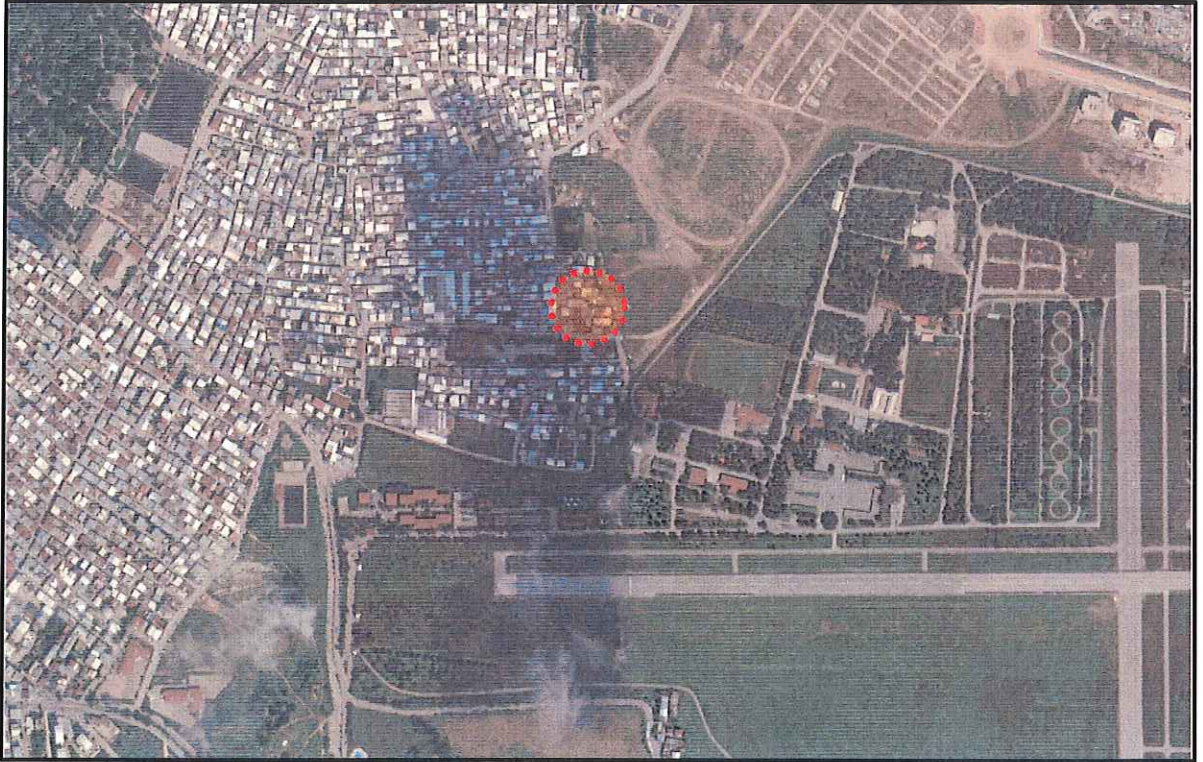
Plan Değişikliği Hazırlanan Alan

Hamitler Mahallesi Bursa Merkezinin kuzeybatısında, Osmangazi Belediye sınırları içindedir. Değişikliğe konu parsel konumu itibariyle Hamitler Şengül Cami'nin 40 m kuzeybatısında, Hürriyet Başöğretmen İlk Öğretim Okulu'nun 50 m kuzeyinde yer almaktadır. Parseller batıdan nene hatun caddesine cepheli durumdadır. Plan değişikliğine konu parseller toplamada 10237,09 m 2 , plan değişikliğine konu alan ise 10286,96 m 2 büyüklüğündedir.