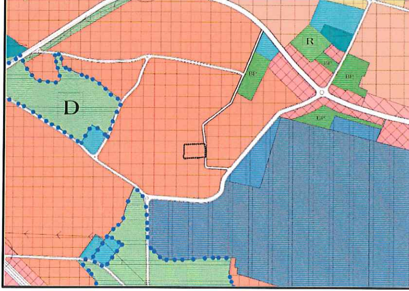
Onaylı 1/25000 Ölçekli Nazım İmar Plan