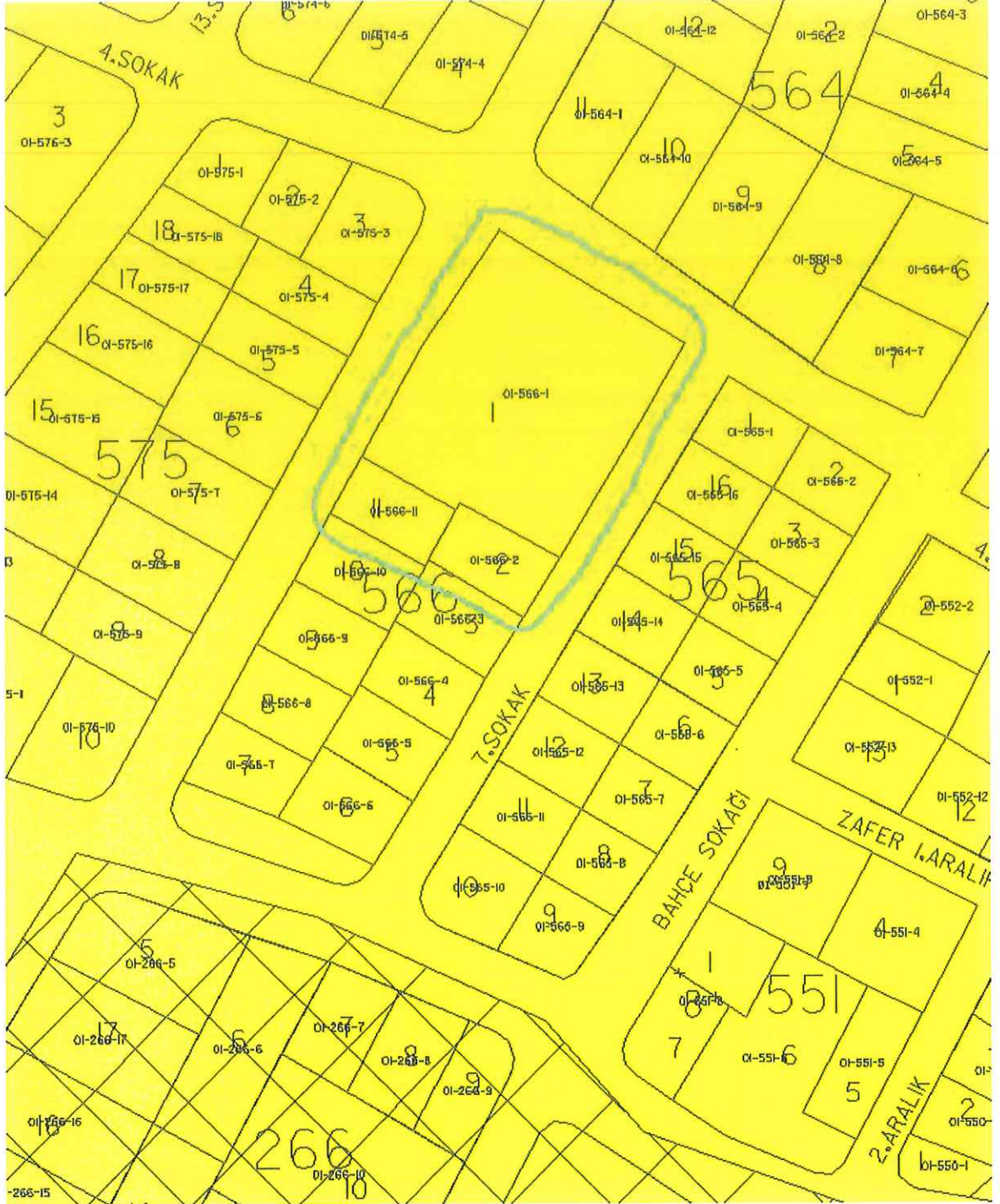
Zemin Etüd paftası