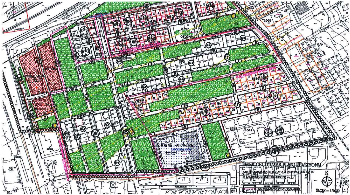
1/1000 ölçekli Plan Değişikliği önerisi

51000 ve 30000 m2 büyüklüklerinde olan 6362 ada, 4 ve 6 parsellerde onaylı imar planı ile mevcut yapılaşmanın uyumsuz olması, bu durumun bölgede yaşayan sakinlerin altyapı konusunda problemler yaşamaları nedeniyle, mevcut sokakların mümkün olduğunca açıldığı, çevresindeki yollarla bağlantılarının sağlandığı, oluşan ada derinlikleri nedeniyle yapılaşma nizamının Bitişik Nizam 2 kat olarak düzenlendiği, onaylı imar planındaki yeşil alanların büyüklüğünün azaltılmadığı şekilde 6362 ada, 4 ve 6 parsellerde hazırlanan 1/1000 ölçekli plan değişikliği önerisi hazırlanmıştır.