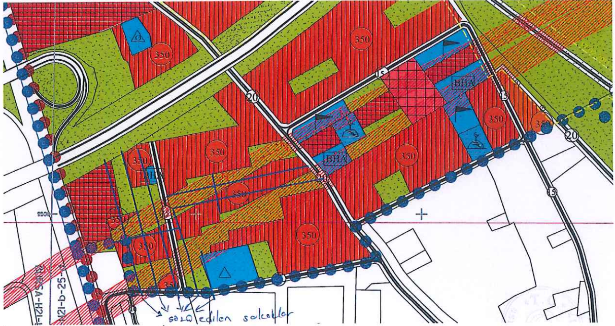
Onaylı 1/5000 ölçekli Nazım İmar Planı

Büyükşehir Belediye Meclisi'nin 13.07.2006 gün ve 475 sayılı kararı ve 16021014/472 sayı ile onaylı 1/1000 ölçekli Emek Geçit İmar Planı Revizyonu kapsamında ise kısmen Ayrık Nizam 5 katlı TAKS=0,25 , KAKS=1,25 konut alanı, kısmen Park Alanı, kısmen de 7 ve 10 m'lik yollarda kaldıkları, 2 sıra olan 350 kw'lık Enerji Nakil Hattı altında kalan kısımlarının bulunduğu, bu kısımların ve salınım payı mesafelerinin de Park alanı olarak düzenledikleri, söz konusu sokakların imar yoluna cepheli olmadıkları tespit edilmiştir.