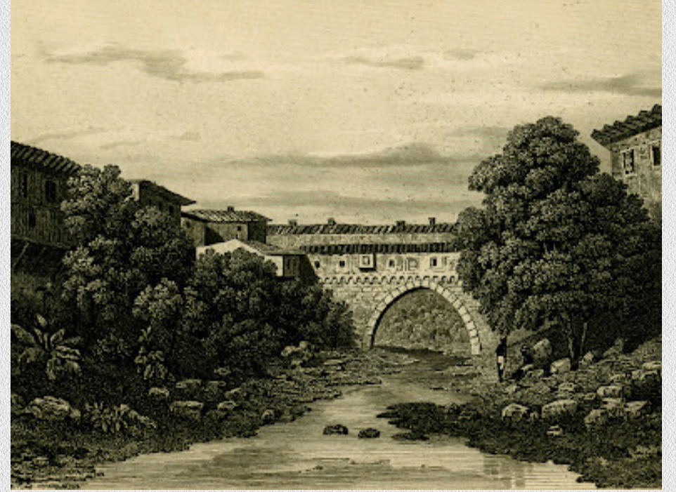
Gezgin Charles Texier Gravürü

Irgandı Köprüsü, yüzyıllar boyunca geçen süreçte yangınlar, depremler ve savaşlarla zarar görmüş ancak ilk formunu koruyamasa da günümüze değerli ayakta kalmayı başarmıştır. 1855 yılında yaşanan büyük depremde üstünde bulunan çarşılar büyük ölçüde yıkılmıştır. Köprü, en büyük yıkımı ise Millî Mücadele döneminde yaşar. 1922 yılında işgal kuvvetleri Bursa'dan çekilirken, Irgandı Köprüsü'nü dinamitleyerek tamamen tahrip etmiştir. 1949 yılında üstündeki çarşısı ve özgün yapısı dikkate alınmadan, sadece iki yakayı bağlamak amaçlı olarak yeniden yapılmıştır.